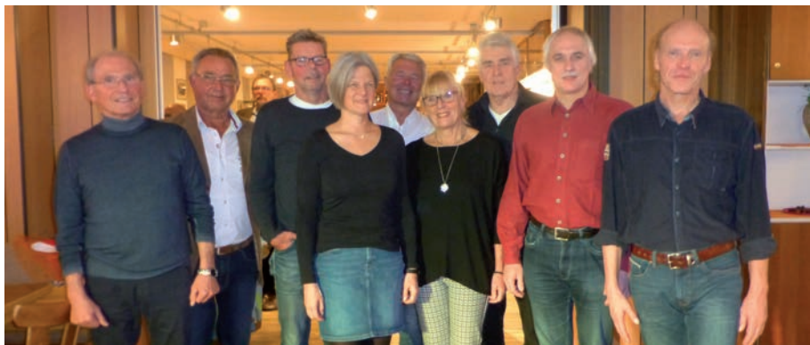
Viele Masters-Schwimmer wurden für ihre starken Leistungen geehrt.