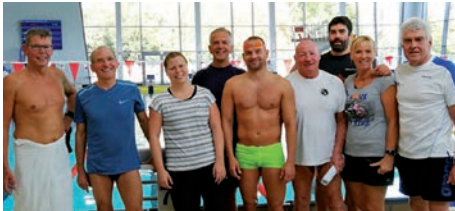
Mit ihren Leistungen in Essen konnten die Masters richtig zufrieden sein.

Neun Masters-Schwimmer des SV 13 gingen beim 21. Internationalen Schwimmfest in Essen an den Start. Das Ergebnis kann sich mit 21 ersten Plätzen wirklich sehen lassen.