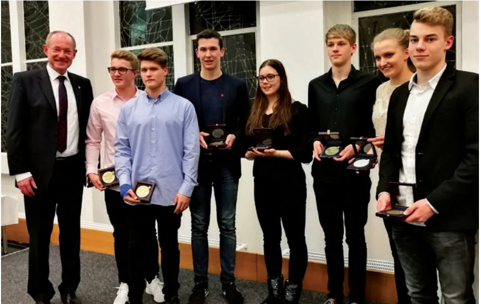
Erfolgreiche Schwimmerinnen und Schwimmer wurden von Bürgermeister Ulrich Roland mit der Sportplakette in Bronze geehrt.

Bei der traditionellen „Feierstunde des Sports“ im Ratssaal stand die Überreichung der städtischen Sportplaketten im Mittelpunkt, und auch der SV Gladbeck 13 ging nicht leer aus.