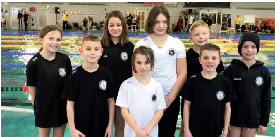
Erfolgreich schnitten die heimischen Aktiven beim NRW-Mehrkampf ab.

Beim Schwimm-Mehrkampf NRW in Bochum hat die SG Gladbeck/Recklinghausen sehr gut abgeschnitten. Dort waren die besten 30 Mädchen und Jungen aus Nordrhein-Westfalen startberechtigt. Acht Starter aus der Sportgemeinschaft Gla/Re waren dabei.