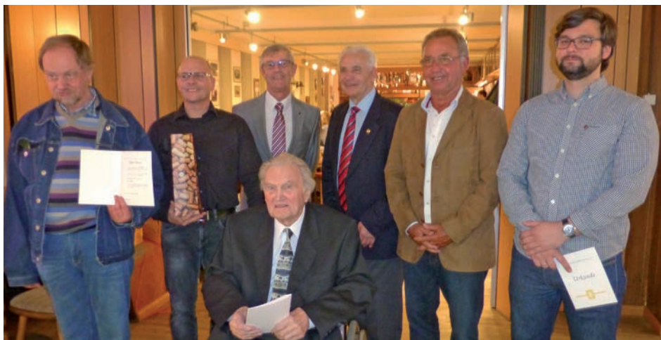
Langjährige Vereinstreue wurde mit Ehrennadeln und Ehrengaben belohnt.